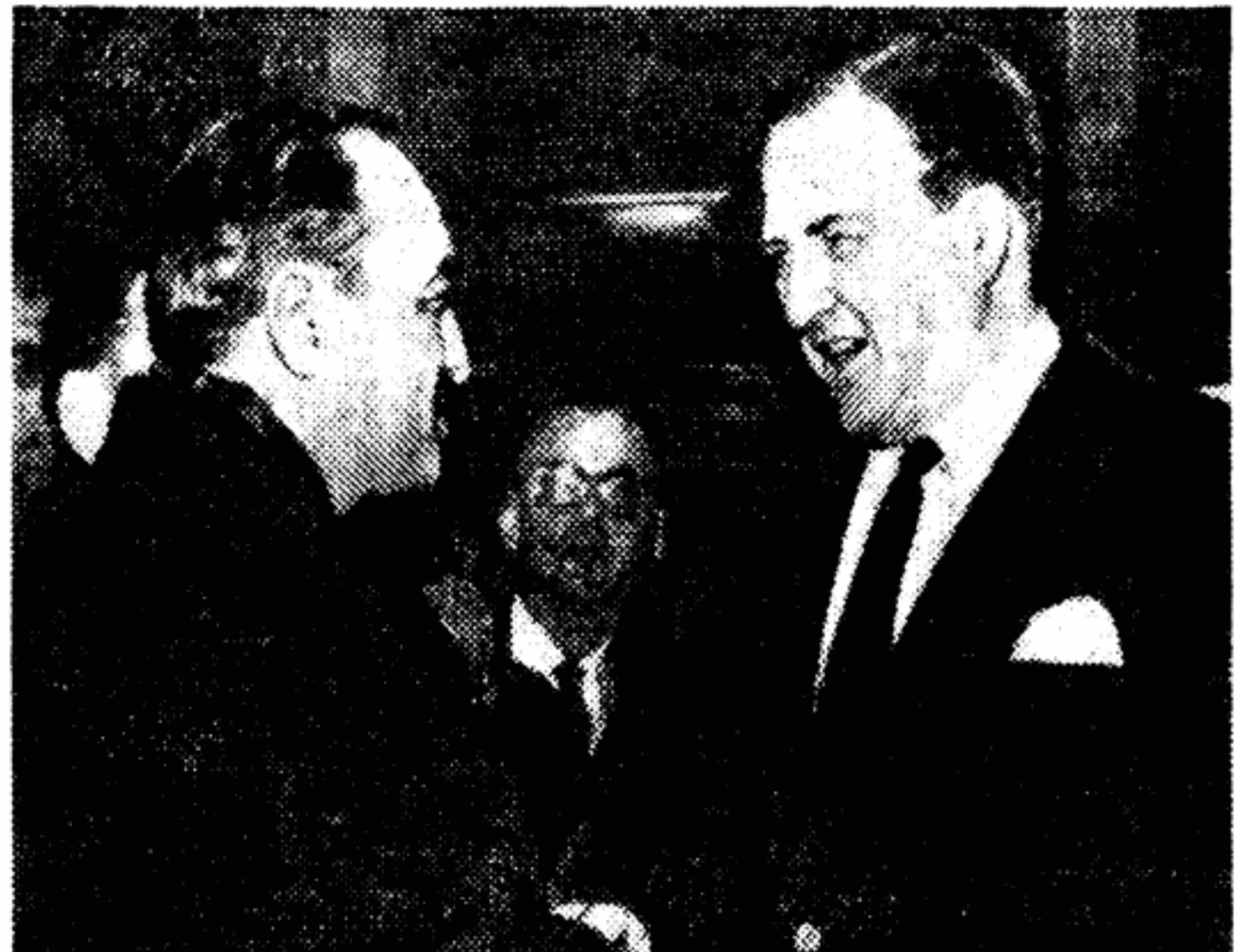
А. И. Манюлин и известный американский промышленник Генри Форд II во время посещения автомобильного завода «Рисерврум» в Детройте.

Ю. КУРЧОК ХАНОЙ, 21 января. (По телефону)