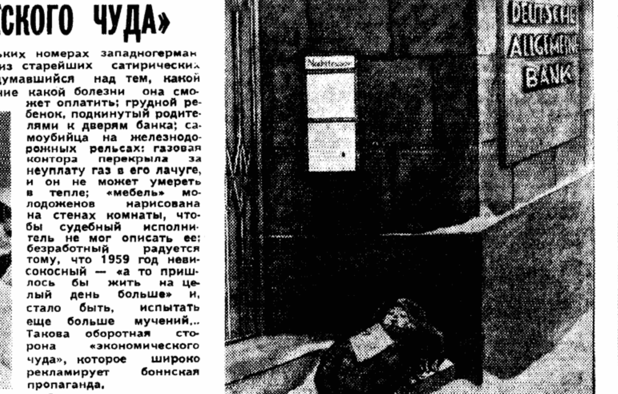
ТАК ОН НАЧИНАЕТ ЖИЗНЬ... Рисунок художника Генриха