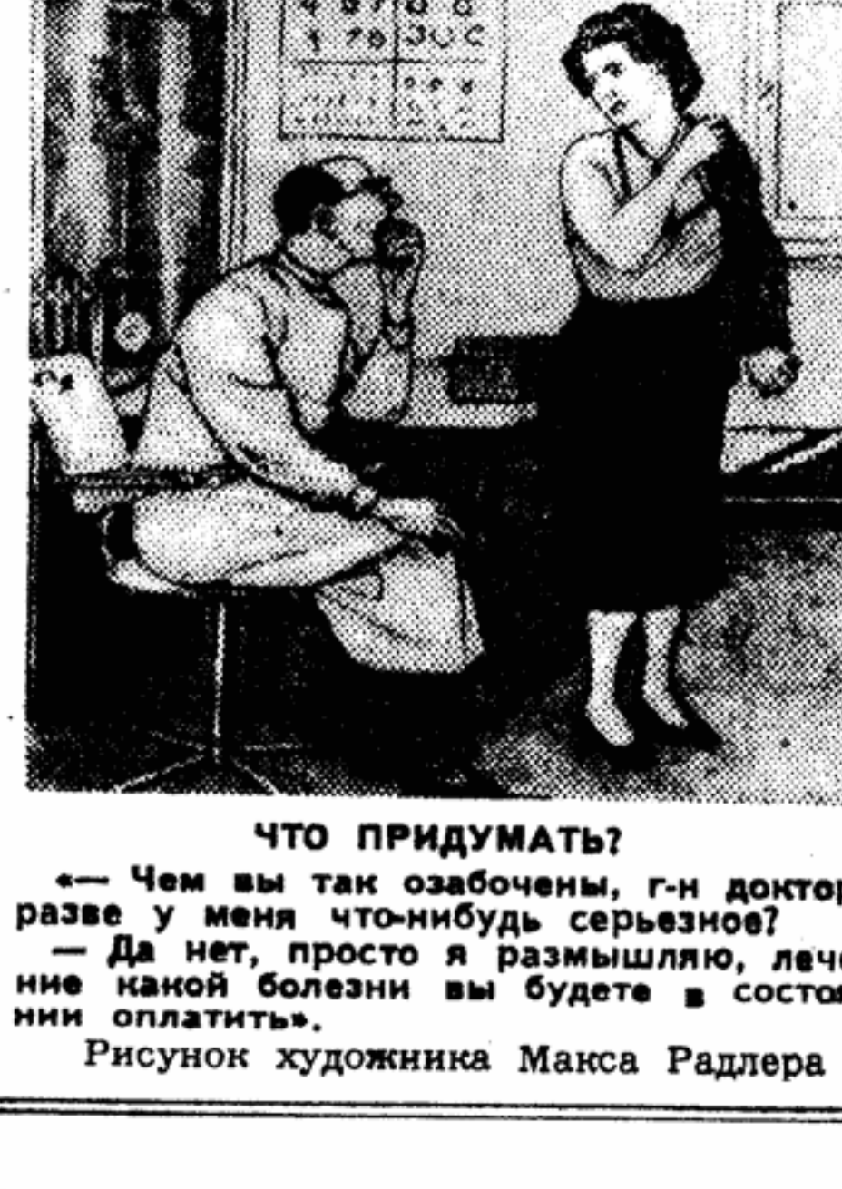
ЧТО ПРИДУМАТЬ? Чем вы так озабочены, гн доктор, разве у меня что-нибудь серьезное? — Да нет, просто я размышляю, лечение какой болезни вы будете в состоянии оплатить. Рисунок художника Макса Радлера