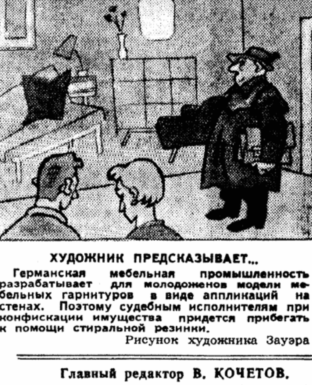
ХУДОЖНИК ПРЕДСКАЗЫВАЕТ... Германская мебельная промышленность разрабатывает для модолюбивых модных женщин гарнитуров в виде аппликаций на стенах. Поэтому судейским исполнением при конфискации имущества придется прибегать к помощи стиральной машины. Рисунок художника Заура