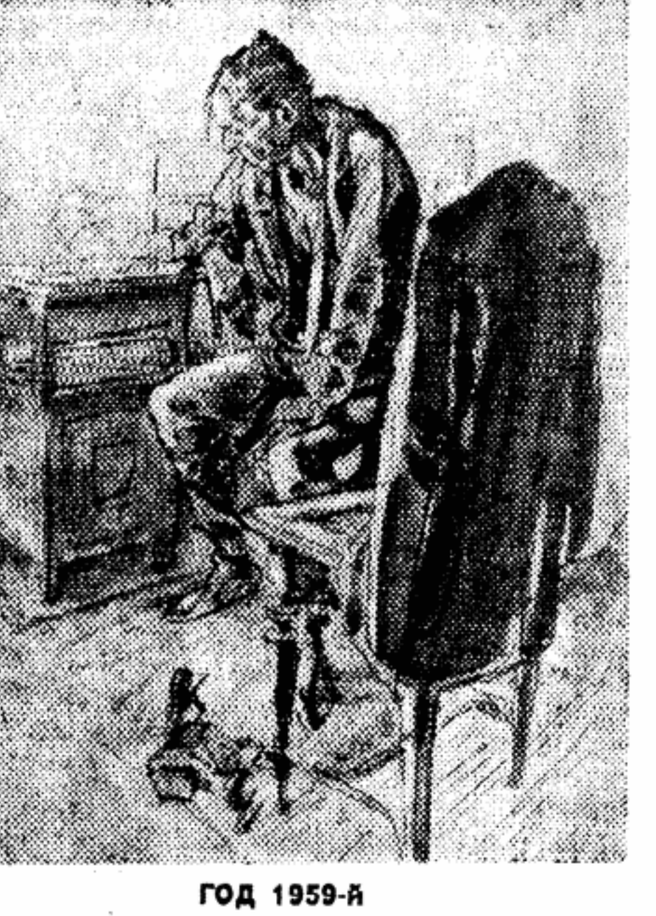
«Хорошо хоть, что этот год немисосносный, а то пришлось бы жить на целый день больше». Рисунок художника Буша